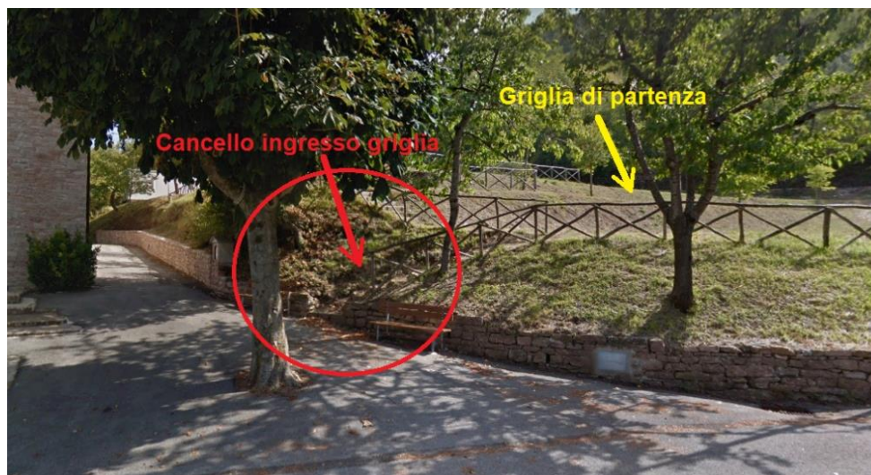
Fig. 2. Cancello d'accesso alla griglia di partenza.